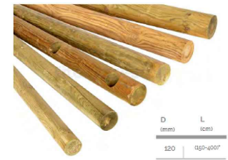
Postes de de fusta de Ø 12 cm, ancorats al terreny