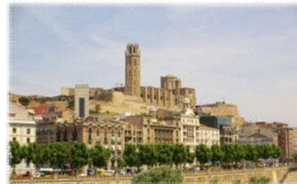
Lleida: una ciutat cada dia més verda