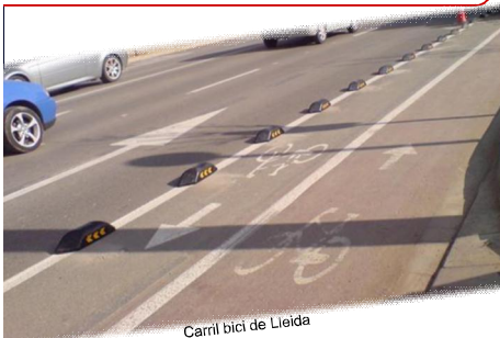
Carril bici de Lleida

Esperem, que amb el transcurs d'aquesta presentació puguem comprendre que no és un problema d'uns quants, sinó un problema global.