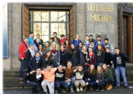
Intercanvi d'idees entre alumnes del nostre Institut i d'Alemanya

"Recerca general sobre els temes tractats.