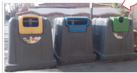
El diferent ordre en la col·locació dels contenidors dificulta la tasca de reciclatge per als invidents