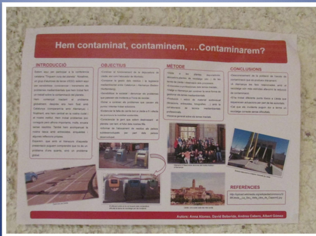
Pòster del nostre institut

Bàsicament s'exposen diferents propostes que fan escoles de tot Catalunya per tal d'intentar millorar la sostenibilitat de la seva ciutat o poble.