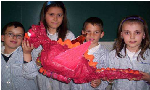
“Els alumnes de cicle mitjà hem aprofitat materials per fer titelles” (Col Anunciata)