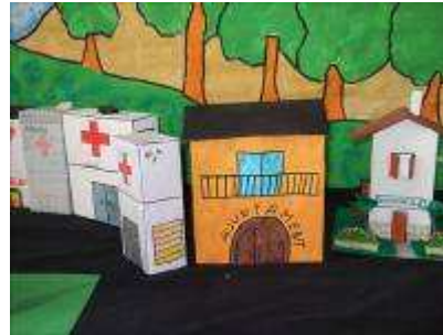
“Construïm edificis reutilitzant brics i cartró” (Col El Carme)