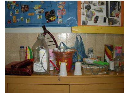
“Fem instruments musicals i una baldufa a partir de materials per reciclar” (Col Sagrada Família)