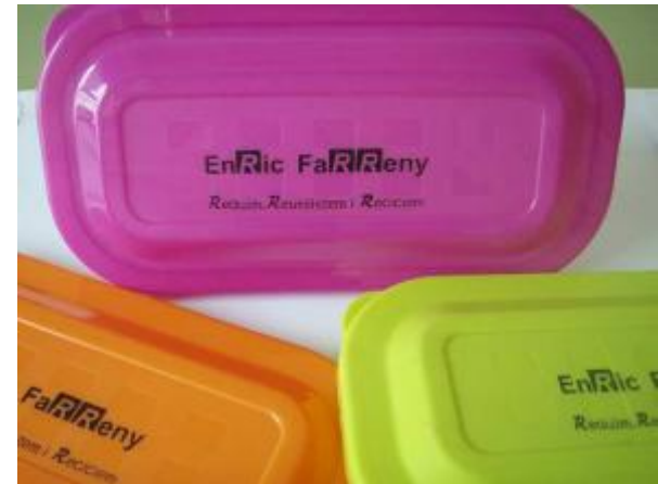
Escola Enric Farreny