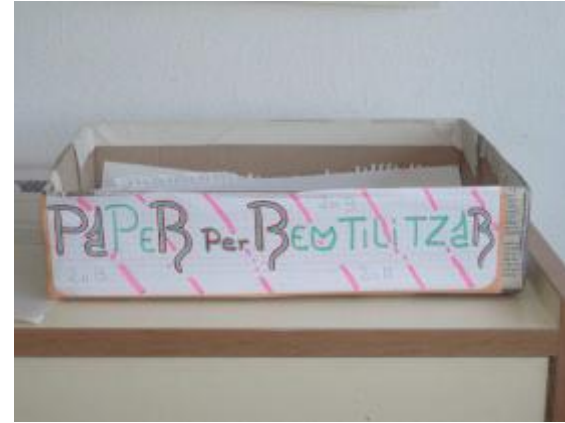
Institut M a Rúbies