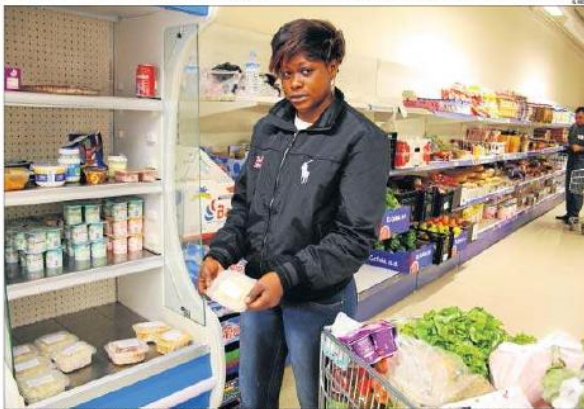
Una usuària del servei d'aliments d'Arrels-Sant Ignasi mostra una de les racions de menjar cuinades al menjador de Maristes.

FUTUR La iniciativa només fa un mes que està en marxa, però l'objectiu és ampliar-la a més centres el pròxim curs