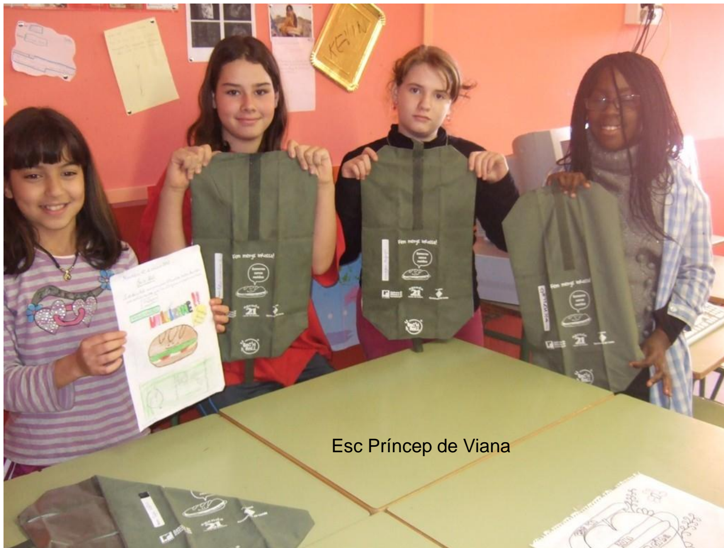
Esc Príncep de Viana