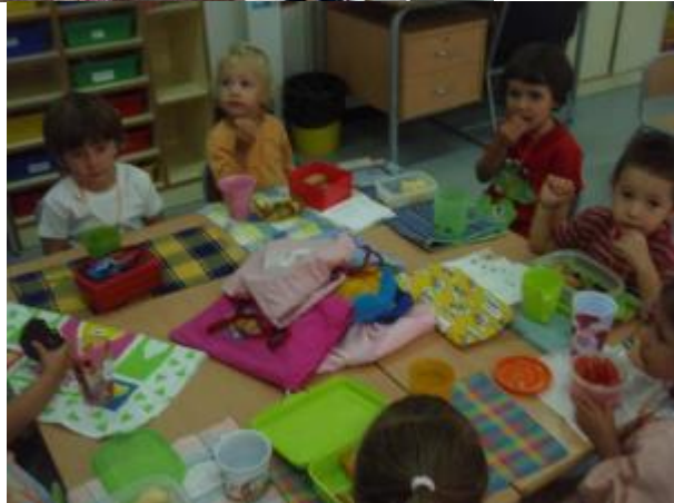
Escola Països Catalans