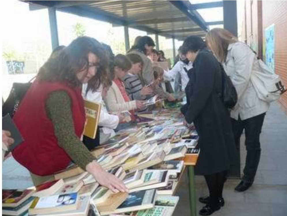
Mercat d'intercanvi de llibres per la diada de Sant Jordi Col·legi Sant Jordi

Altres propostes... MERCATS D'INTERCANVI