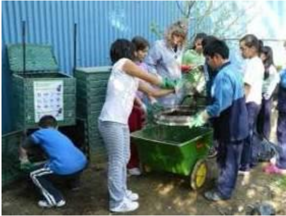
Escola Camps Elisis