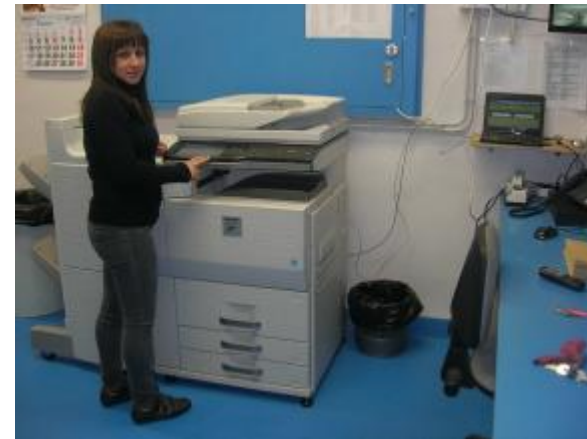
Institut Samuel Gili i Gaya