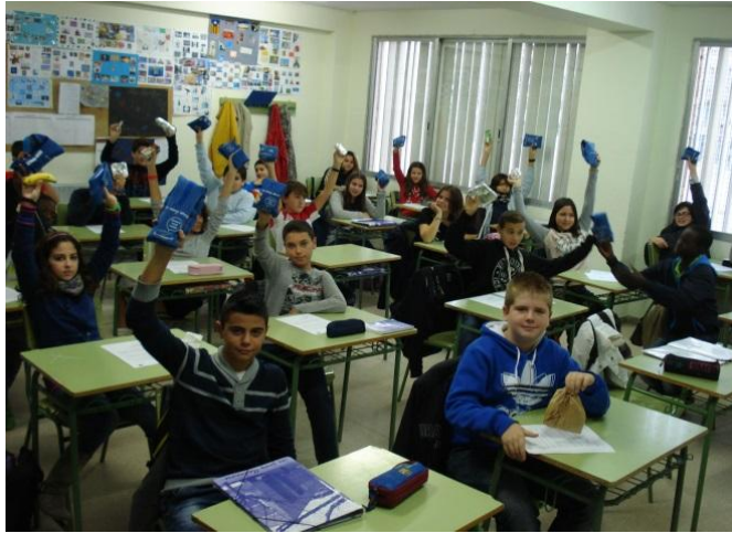
Institut Torre Vicens