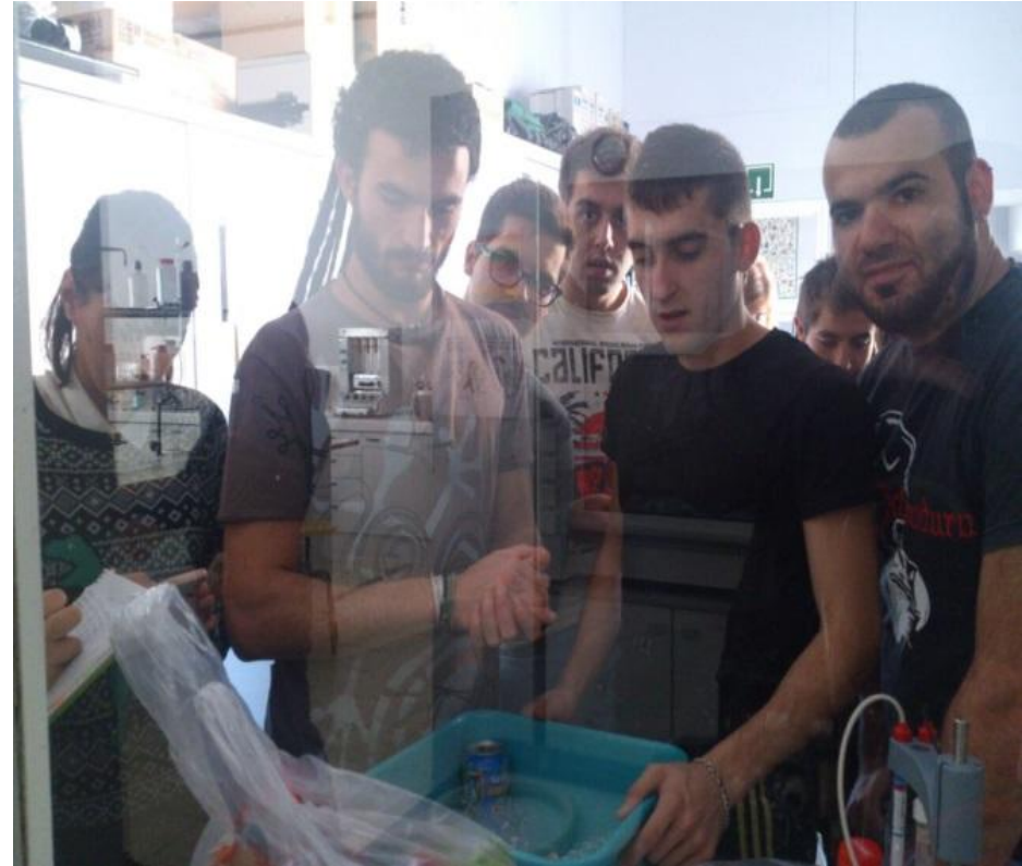
Institut Escola del Treball