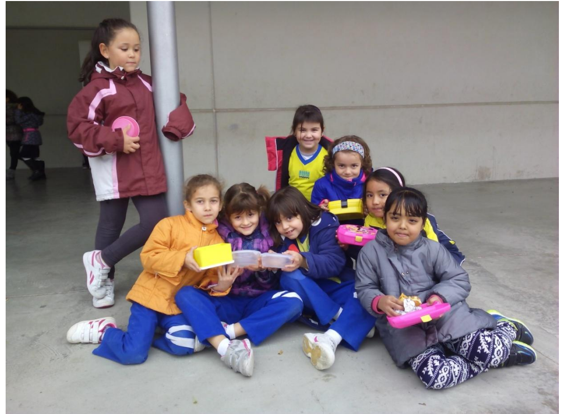
Escola Riu Segre