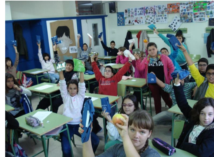
INS Josep Lladonosa