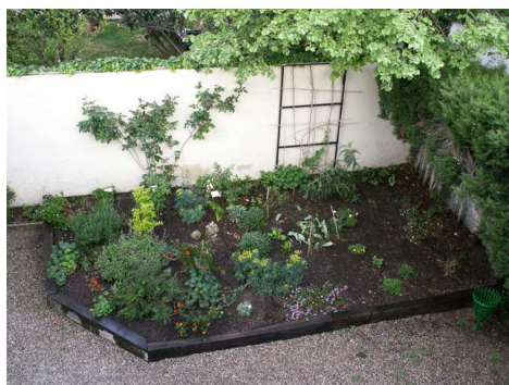
Jardí de papallones Col·legi Stel·la