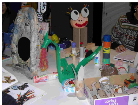
Sessió a Traç