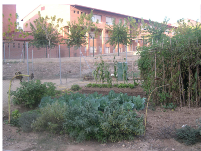
CEIP P. Països Catalans