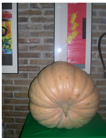
CEIP Escola Espiga

Recordeu que també s'ha programat formació en els àmbits de la gestió dels residus, el pati escolar i l'energia. Podeu consultar l'informatiu n.1 d'aquest curs, on trobareu les dates de cada proposta.