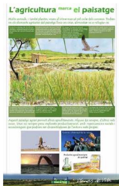
Plafó de l'exposició “Els Secans Vius”