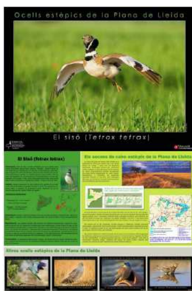
Pòster del sisó