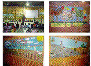
Tres paisatges de Lleida per situar la biodiversitat Escola Sant Jordi

Es van presentar propostes com: Ecoauditories de biodiversitat, projecte "Adoptem la ciutat", "Apropa't al parc", Itinerari urbà de natura i Retall de natura ("Els altres veïns), activitats sobre biodiversitat del "Hàbitat", i un parell d'experiències realitzades a l'ESC Sant Jordi i a l'ESC La Mitjana.