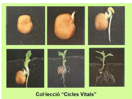
Col·lecció “Cicles Vitals”

S'han realitzat dues sessions més del curs “Un hort a l'escola”. Les dues sessions (19 de gener i 2 de febrer), a l'Escola Riu Segre, han estat dedicades a treballar sobre l'aprofitament didàctic que podem fer d'un gran recurs educatiu com és un hort escolar. S'han proposat diferents propostes per aprendre sobre les plantes i treballar amb elles les tres funcions característiques dels éssers vius (nutrició, relació i reproducció). Entre altres: maquetes dels òrgans de les plantes (arrels, tiges, fulles) i experiències per entendre com es fan aquests processos, i activitats d'observació i experimentació amb flors, fruits i llavors.