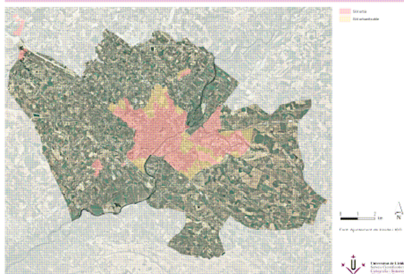
Mapa 2. El límit entre la ciutat i l'Horta i la classificació urbanística del sòl (setembre 2011)

Cultius, canals, sèquies, torres,... formen un paisatge productiu amb identitat pròpia que també actua de pulmó verd de la ciutat.