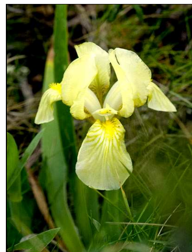
Detall de la flor del lliri groc

RECORDEU: no està permesa la recol·lecció de cap planta ni animal dins aquest espai!!!