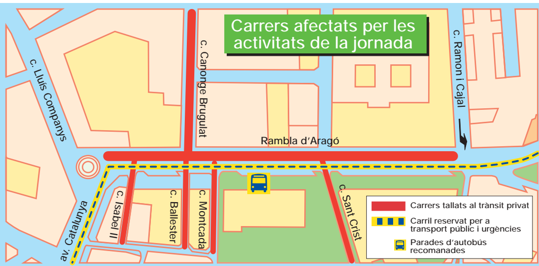
La Rambla Ferran acollirà un any més diverses activitats de sensibilització.