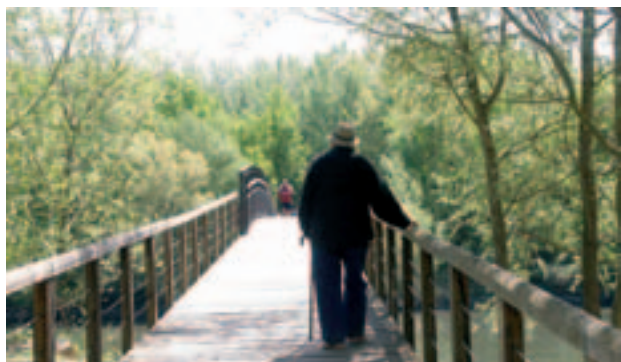
La Mitjana és un dels escenaris del programa educatiu.

El programa Lleida en Viu, organitzat per la Regidoria de Sostenibilitat i Medi Ambient, ha encetat una nova edició amb activitats per a escolars i per als ciutadans