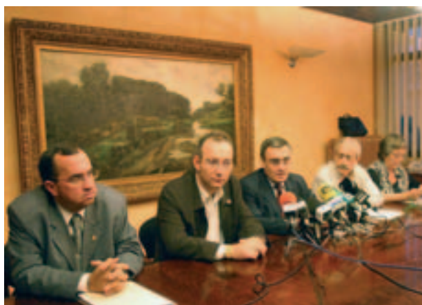
L'alcalde va informar de la proposta de la Comissió de Medi Ambient.