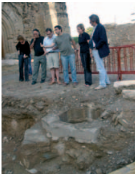
Les troballes aporten més dades sobre el monument.

Les restes, juntament amb les pintures del segle XIII trobades a l'interior del castell en una investigació prèvia, aporten més dades sobre la història d'aquest monument de Lleida que la Paeria vol potenciar com a punt d'interès turístic i cultural. El primer dels tres sondejos s'ha portat a terme sobre la superfície del pati, al costat del tancament oest de la torre del castell. En aquests punt s'ha localitzat un accés format per un túnel de 10 metres de llargada que parteix de la paret oriental de l'antiga cisterna medieval.